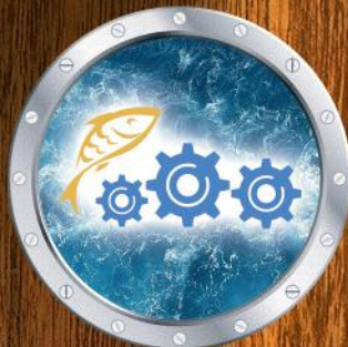
Fish processing equipment Рыбообработывающее оборудование