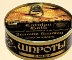
№3 Ø99mm – 240 g