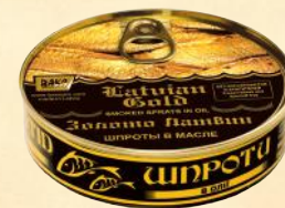
№2 Ø99mm – 160 g