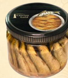
Ø84mm – 250 g