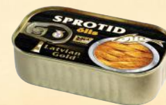
CLUB – 115-125 g