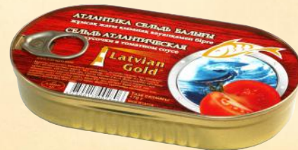
Hansa – 170-190 g