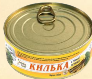
№3 Ø99mm – 240 g