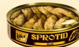
№2 Ø99mm – 160 g