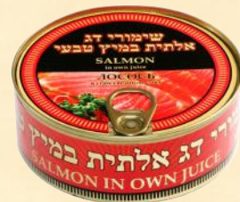
№3 Ø99mm - 240 g