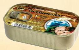
CLUB - 115-125 g