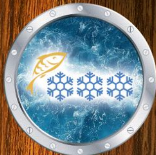
Frozen fish Мороженая рыба