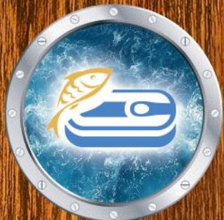
Canned fish Рыбные консервы