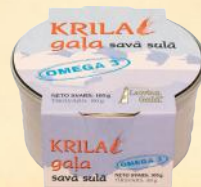
Ø73mm - 105 g