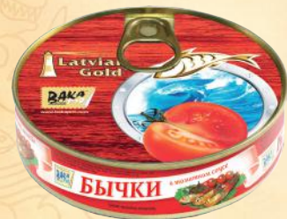
№2 Ø99mm – 160 g