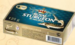
CLUB - 115-125 g