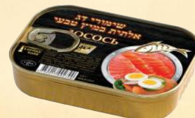
Dingley - 110 g