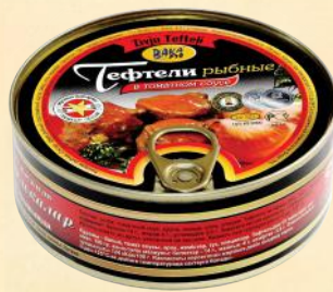
№3 Ø99mm – 240 g