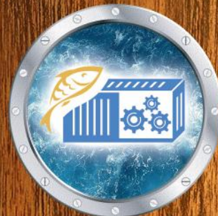
Containerized plant Производство в контейнерах