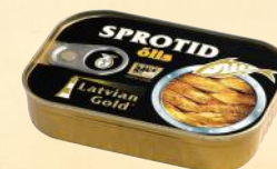
Dingley – 110 g