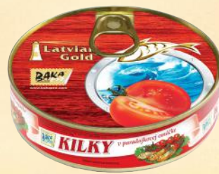
№2 Ø99mm – 160 g