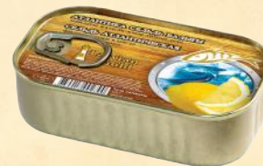
CLUB – 115-125 g