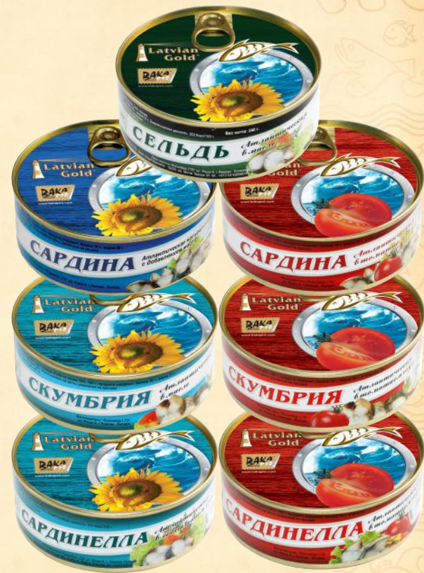
№3 Ø99mm – 240 g