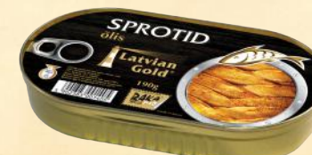
Hansa – 170-190 g