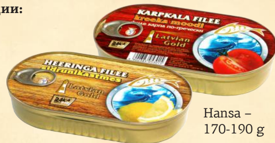
Hansa - 170-190 g